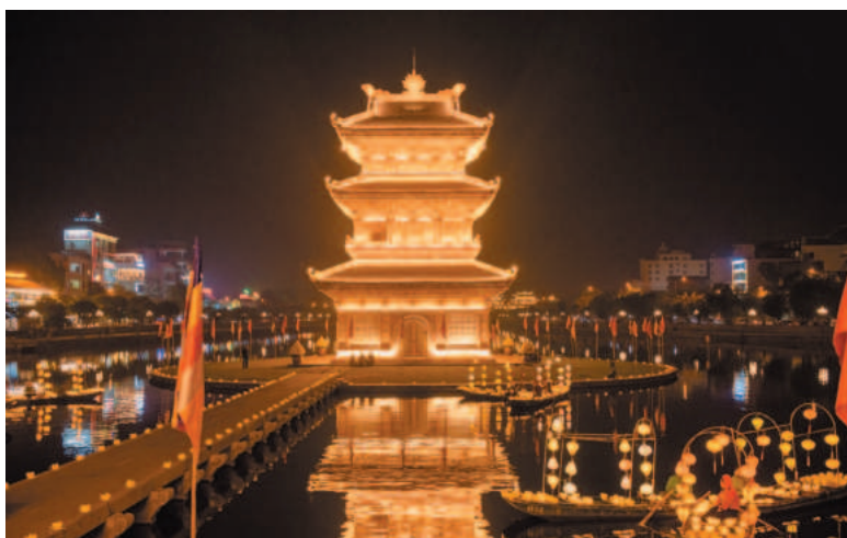
Phố cổ Hoa Lư về đêm

Thời gian tới, TP.Ninh Bình sẽ tiếp tục bám sát quy hoạch phát triển của tỉnh để phát triển KT - XH. Trong đó, xác định công nghiệp là ngành kinh tế mũi nhọn, ưu tiên thu hút các nhà đầu tư phát triển các lĩnh vực công nghiệp. Thông qua đó, gia tăng tốc độ tăng trưởng giá trị sản xuất công nghiệp, tạo dựng thương hiệu của ngành công nghiệp thành phố, đồng thời góp phần chuyển dịch cơ cấu kinh tế, giải quyết việc làm tại chỗ cho đông đảo lực lượng lao động, nâng cao đời sống vật chất cho người dân địa phương. Thành phố luôn chào đón các nhà đầu tư đến tìm hiểu cơ hội đầu tư và đồng hành cùng nhà đầu tư trong suốt quá trình triển khai dự án; tạo điều kiện thuận lợi để các dự án đầu tư hoạt động thông suốt, hoàn vốn nhanh và phát triển bền vững. ■