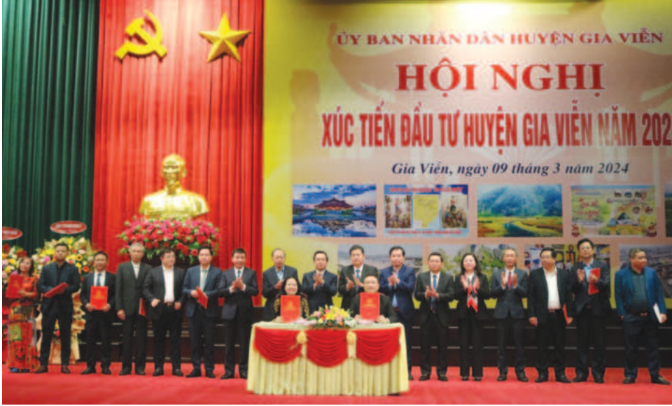
Lãnh đạo UBND tỉnh Ninh Bình, UBND huyện Gia Viễn chứng kiến Lễ ký kết biên bản ghi nhớ hợp tác tìm hiểu đầu tư của các doanh nghiệp về đầu tư trên địa bàn huyện Gia Viễn

Khu bảo tồn thiên nhiên đất ngập nước Vân Long (xã Gia Vân), suối khoáng Kênh Gà (xã Gia Thịnh),... Những di tích lịch sử như Đền thờ vua Đinh Tiên Hoàng - lăng Phát tích, chùa Kỳ Lân (Gia Phương), Thung Lau,... đã và đang trở thành những điểm tham quan du lịch hấp dẫn du khách.