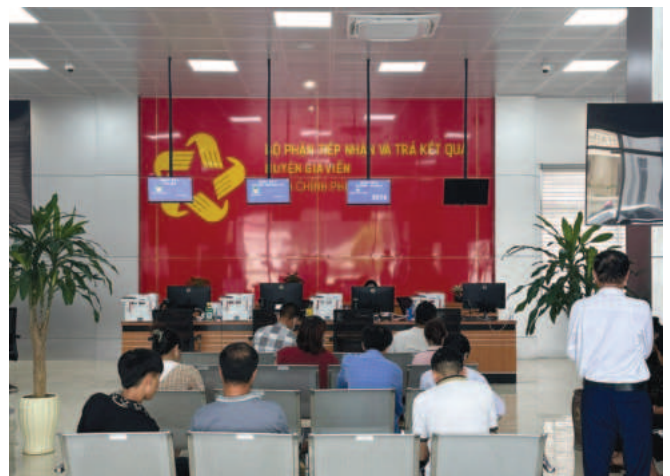
Bộ phận tiếp nhận và trả kết quả giải quyết thủ tục hành chính của huyện Gia Viễn tại Trung tâm Phục vụ hành chính công tỉnh Ninh Bình

thiện trình HĐND huyện Gia Viễn thông qua. Có thể thấy, từ các nguồn vốn ngân sách và huy động nguồn lực trong nhân dân, thị trấn Me thời gian qua đã quan tâm đầu tư xây dựng cơ sở hạ tầng, tạo bộ mặt đô thị ngày càng khang trang, hiện đại, mạng lưới giao thông được quy hoạch, đầu tư, quản lý đúng theo quy định. 100% các tuyến đường, ngõ trên địa bàn thị trấn Me được lắp đặt hệ thống điện chiếu sáng thuận tiện cho việc đi lại và sinh hoạt của nhân dân. Cây xanh đường phố được chỉnh trang, cải tạo và trồng mới, tạo cảnh quan đô thị sáng - xanh - sạch - đẹp... ■