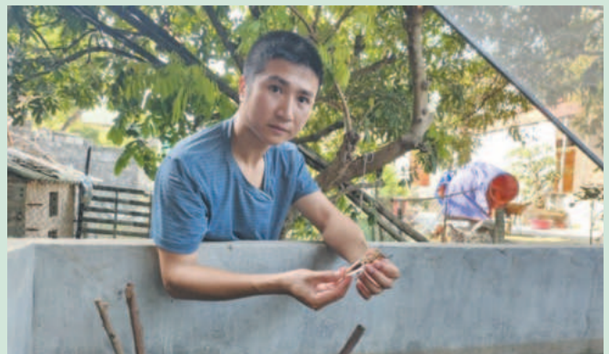
Mô hình cà cưỡng xã Ninh Hòa