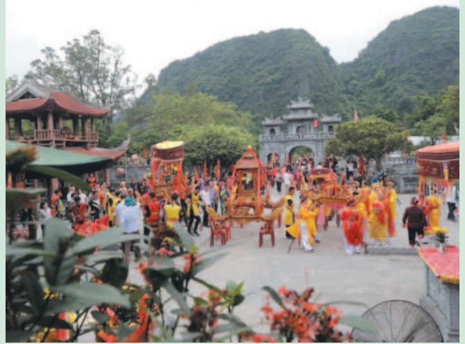
Lễ hội đền Thái Vi, huyện Hoa Lư