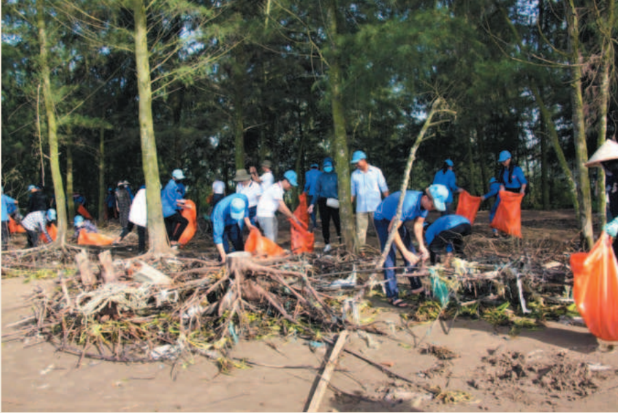
Centralized garbage collection is underway at Con Noi (Noi island), Ninh Binh province

and submitted land allocation decisions of 252.94 ha for 62 projects to the Provincial People's Committee.