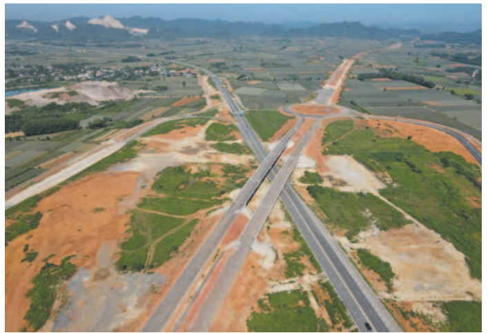
Tuyến đường Đông - Tây sẽ mở ra cơ hội phát triển mới cho huyện Nho Quan

Để tạo môi trường thuận lợi cho doanh nghiệp hoạt động, Nho Quan đã ban hành nhiều văn bản chỉ đạo về thực hiện cải cách thủ tục hành chính. Trong đó, tập trung củng cố, đào tạo và tăng cường năng lực đội ngũ cán bộ lãnh đạo các cấp; xây dựng lại quy chế, quy trình trên tinh thần rút ngắn thời gian thực hiện thủ tục hành chính; đổi mới phương thức làm việc của các cơ quan hành chính nhà nước; đẩy mạnh chuyển đổi số, thực hiện kinh tế số, xã hội số, doanh nghiệp số; tăng cường giải quyết hồ sơ, xử lý công việc trên môi trường điện tử, tạo thuận lợi tối đa cho người dân và doanh nghiệp. ■