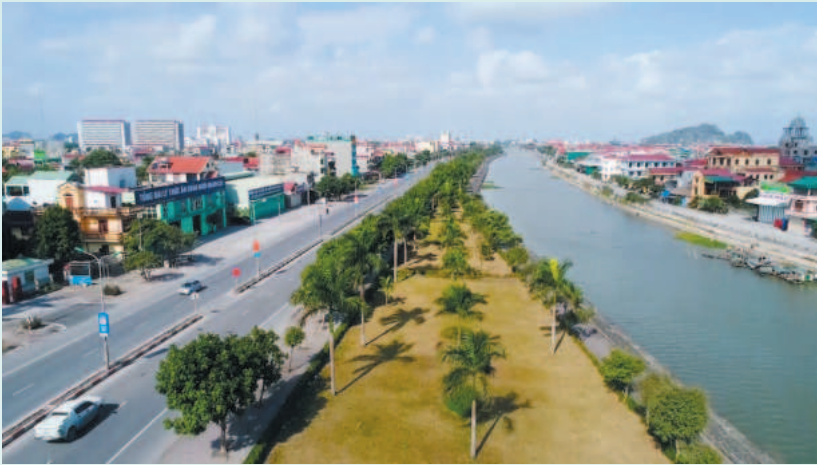
Công ty Cổ phần Môi trường và Dịch vụ đô thị Ninh Bình đã và đang góp phần tạo nên diện mạo sáng - xanh - sạch - đẹp cho tỉnh Ninh Bình

Tiền thân là Công ty Xây dựng và Quản lý đô thị thị xã Ninh Bình được thành lập năm 1986, gần 40 năm xây dựng và phát triển, Công ty Cổ phần Môi trường và Dịch vụ đô thị Ninh Bình đã ngày càng lớn mạnh, góp phần tạo nên diện mạo đô thị Cổ đô sáng - xanh - sạch - đẹp, được người dân và du khách đánh giá cao.