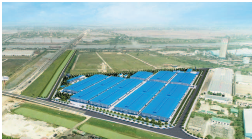
Khanh Phu Industrial Park, Ninh Binh province

From January 1, 2024 to June 27, 2024, the authority received 26 dossiers (two transferred from the previous period) and completed 22. It is processing two dossiers. No late, overdue or delayed cases are reported.