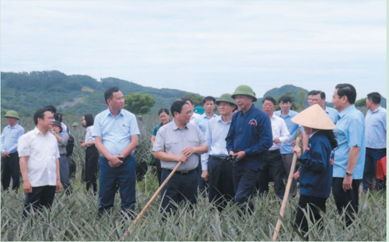
Thủ tướng Chính phủ Phạm Minh Chính thăm và khảo sát một số cơ sở kinh tế - xã hội của tỉnh Ninh Bình, ngày 28/5/2024

Với tư duy phát triển hài hòa, bền vững, Ninh Bình đang nỗ lực tiến gần đến mục tiêu trở thành tỉnh khá trong khu vực Đồng bằng sông Hồng, cơ bản đạt các tiêu chí thành phố trực thuộc Trung ương, trung tâm du lịch quốc gia, mang giá trị toàn cầu vào năm 2030,... Đây không chỉ là kết quả của các quyết sách cụ thể, “đúng” và “trúng” mà còn là sự quyết tâm, nỗ lực bền bỉ, đồng thuận từ chính quyền địa phương, các doanh nghiệp và cộng đồng dân cư.