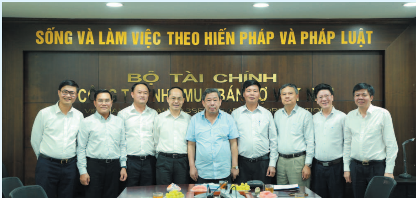
DATC liên tục nhận được Bằng khen của Bộ Tài chính về việc thực hiện nghiêm túc chính sách, pháp luật về thuế

Công ty TNHH Mua bán nợ Việt Nam (DATC) vừa công bố báo cáo tình hình thực hiện nhiệm vụ, kết quả hoạt động kinh doanh 6 tháng đầu năm 2024 với tổng doanh thu ước thực hiện 1.858,8 tỷ đồng (khoảng 324% so với cùng kỳ năm 2023), hoàn thành 75,6% kế hoạch của cả năm 2024. Doanh nghiệp (DN) cũng đặt ra các giải pháp cho hoạt động nửa cuối năm, nhằm hoàn thành xuất sắc các chỉ tiêu năm 2024.