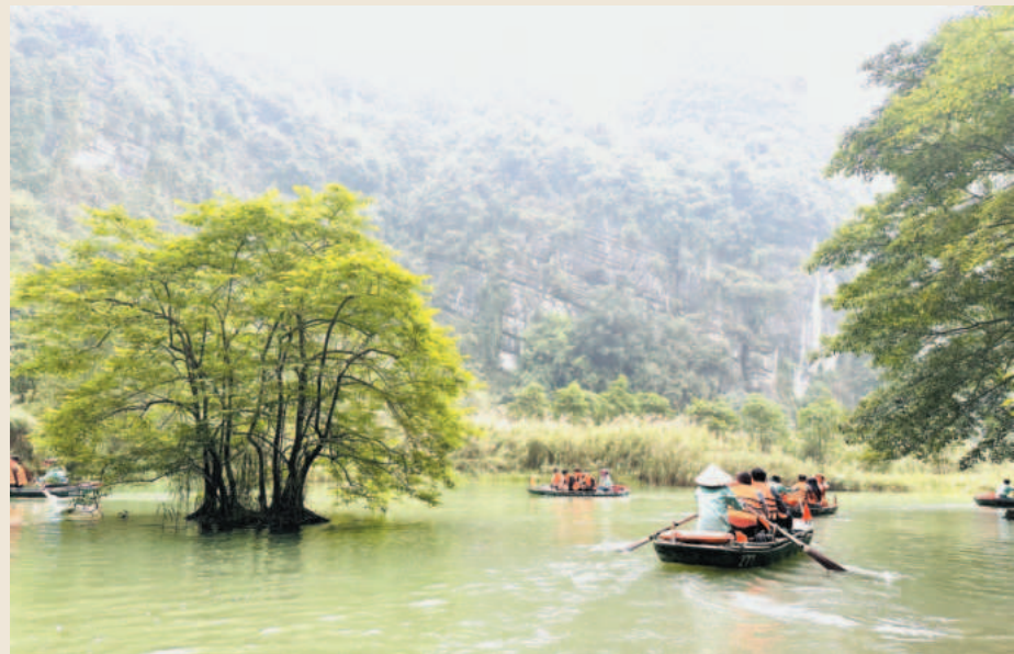
Ninh Binh province is advancing "green tourism" to foster sustainable growth

“The natural resources and environment sector will actively remove difficulties in natural resources and environment management and clearly define job titles, job descriptions, work processes, responsibilities and outcomes. Doing so, not only will the assigned tasks be completed well but also contribute to improving the provincial competitiveness in particular and attracting investment capital for local socioeconomic development in general,” he said. ■