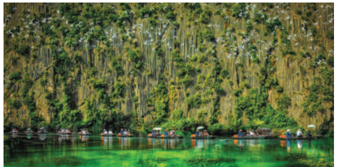
Đầm Vân Long trên địa bàn huyện Gia Viễn là một thắng cảnh thu hút khách du lịch của tỉnh Ninh Bình

Huyện Gia Viễn đang nỗ lực không ngừng để hiện thực hóa mục tiêu trở thành thị xã vào năm 2030. Với sự chỉ đạo mạnh mẽ từ Trung ương và tỉnh Ninh Bình, cùng với những giải pháp cụ thể trong cải cách hành chính, xây dựng chính quyền điện tử và phát triển đô thị xanh, Gia Viễn đang tạo ra nền tảng vững chắc cho sự phát triển bền vững trong tương lai.