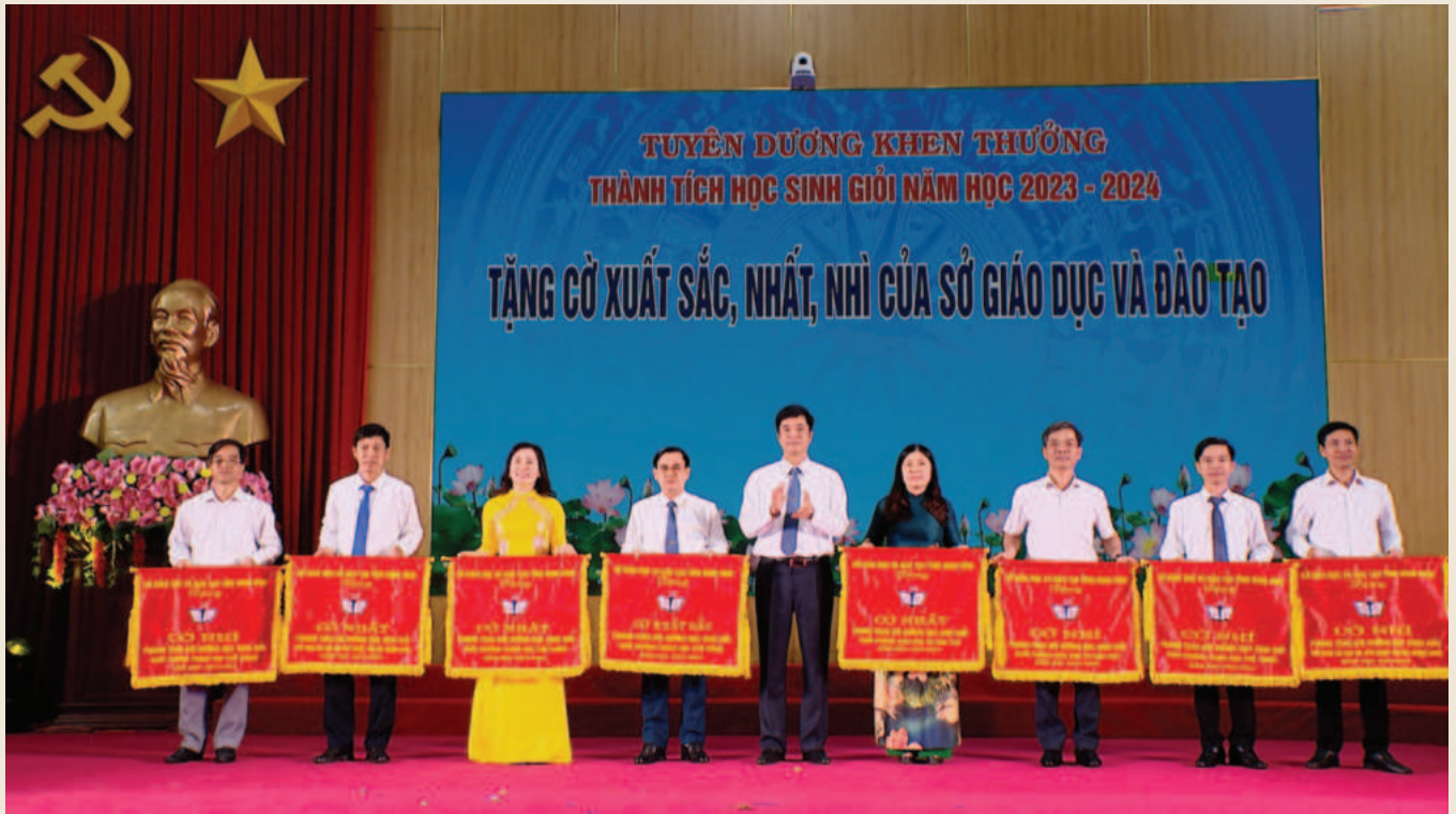
Lãnh đạo Sở Giáo dục và Đào tạo tỉnh Ninh Bình trao cờ cho các tập thể có thành tích xuất sắc trong công tác bồi dưỡng học sinh giỏi

Chất lượng giáo dục toàn diện, mũi nhọn không ngừng được củng cố và nâng cao; 97,9% trường mầm non, phổ thông đạt chuẩn quốc gia; kết quả thi tốt nghiệp THPT nhiều năm liền đứng trong Top 5 tỉnh, thành phố dẫn đầu cả nước; nhiều dự án đạt giải tại kỳ thi Khoa học - kỹ thuật học sinh trung học cấp quốc gia,... Những kết quả nổi bật của ngành Giáo dục và Đào tạo (GDĐT) Ninh Bình đã góp phần quan trọng vào sự phát triển kinh tế - xã hội của tỉnh và cả nước.