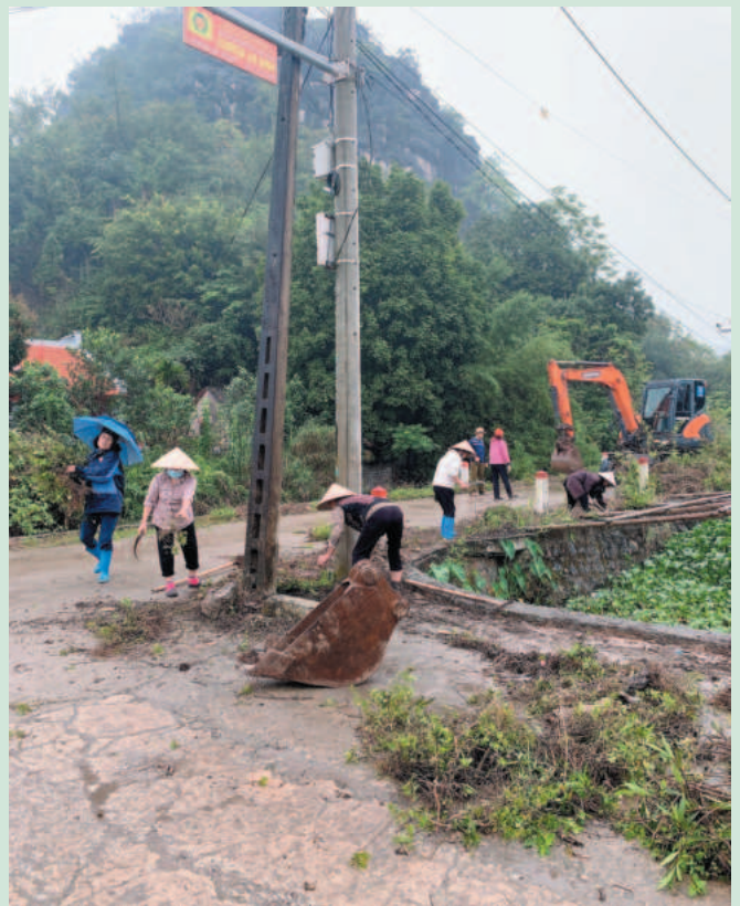
Cán bộ hội viên Hội phụ nữ xã Trường Yên tham gia trồng Đường cây kiểu mẫu