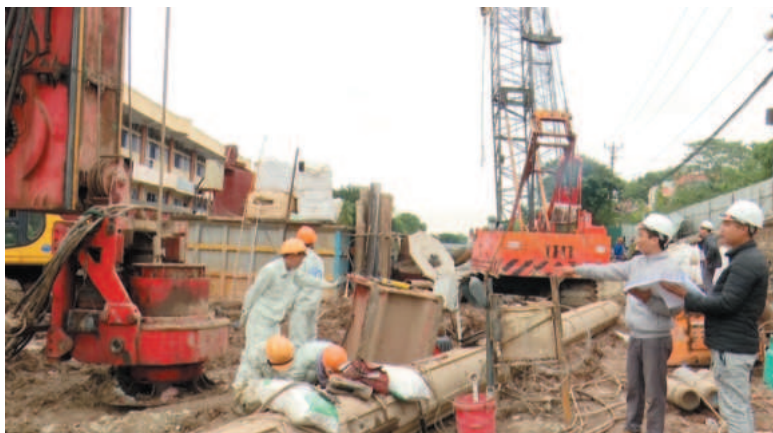
Nhà thầu thi công đang gấp rút triển khai thi công cầu Cà Là