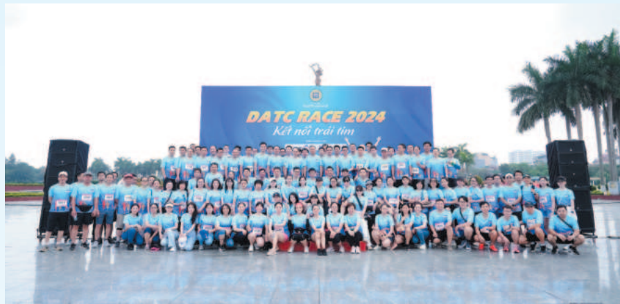
Phát triển văn hóa doanh nghiệp bằng sự gắn kết, xây dựng tập thể vững mạnh là một trong những giải pháp quan trọng để DATC hoàn thành các nhiệm vụ đề ra

Ngoài ra, các công tác xây dựng, hoàn thiện cơ chế chính sách; công tác bộ máy nhân sự, tiền lương; công tác đầu tư dự án, xây dựng cơ bản; công tác tài chính – kế toán, thanh kiểm tra; công tác kế hoạch, hợp tác, thị trường; công tác tuyên truyền, quảng bá,... đều được lãnh đạo và người lao động DATC quan tâm và tích cực thực hiện trên tinh thần “gắn kết để phát triển”.