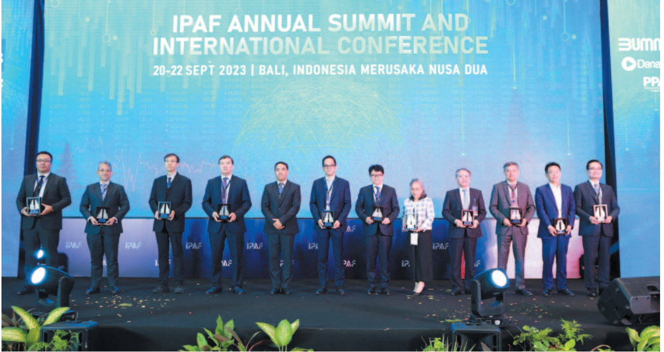
DATC leaders participated in the IPAF Summit and Conference, held in Bali, Indonesia