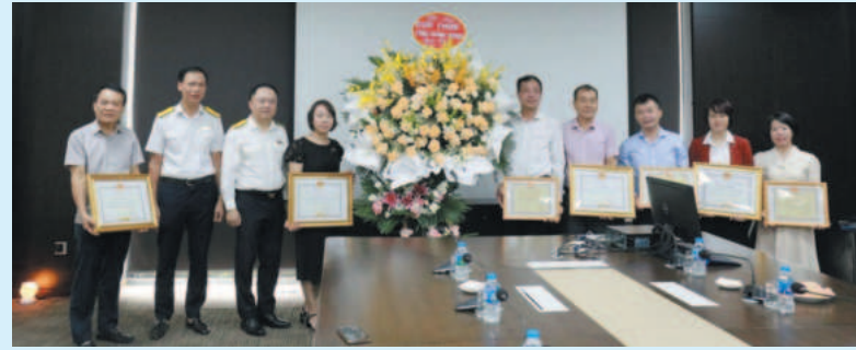
Cục trưởng Cục Thuế tỉnh Ninh Bình trao thưởng cho các đơn vị thuộc Tập đoàn Thành Công có thành tích chấp hành tốt chính sách thuế năm 2023

Theo đó, Cục tiếp tục ứng dụng công nghệ thông tin, đổi mới, hiện đại hóa công tác tuyên truyền, hỗ trợ người nộp thuế (NNT) và xây dựng các sản phẩm hỗ trợ NNT theo phương thức điện tử. Trong 6 tháng đầu năm 2024, toàn ngành đã tiếp nhận, phối hợp xử lý và trả kết quả gần 7.000 lượt hồ sơ khai thuế, hồ sơ đăng ký mã số thuế thu nhập cá nhân cho NNT. Tỷ lệ nộp hồ sơ khai thuế điện tử đạt trên 98% tổng số hồ sơ khai thuế đã nộp.