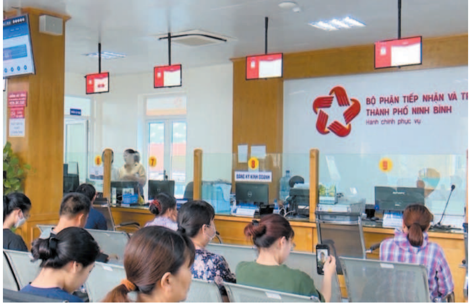
Công tác chuyển đổi số của tỉnh Ninh Bình đạt nhiều kết quả ấn tượng

của Bộ TT&TT, đến ngày 01/6/2024, Ninh Bình xếp thứ 03/63 tỉnh, thành phố về số lượng tài khoản đăng ký học viên và xếp thứ 06/63 tỉnh, thành phố về tỷ lệ học viên hoàn thành các khóa học trên nền tảng (khoảng 70%). Tính từ ngày 01/01/2024 đến hết 01/6/2024, Sở TT&TT (Trung tâm Công nghệ TT&TT) đã chủ trì tổ chức 30 lớp tập huấn, bồi dưỡng, nâng cao nhận thức về kỹ năng số cho 751 lượt lãnh đạo, công chức, viên chức, người lao động tại các huyện, thành phố.