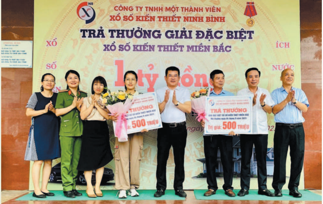
Công ty TNHH MTV Xổ số Kiến thiết Ninh Bình trao giải cho khách hàng trúng thưởng

Không chỉ nỗ lực trong hoạt động sản xuất kinh doanh, XSKT Ninh Bình còn chú trọng quan tâm, chăm lo, đảm bảo và nâng cao đời sống cho người lao động. Các chế độ về tiền lương, thu nhập, bảo hiểm xã hội, bảo hiểm y tế,... được thực hiện đầy đủ. Ban lãnh đạo Công ty thường xuyên tổ chức các chương trình đào tạo để nhân sự trao đổi kỹ năng làm việc linh hoạt hơn, nâng cao năng lực chuyên môn; đồng thời thực hiện sắp xếp lại các phòng chuyên môn, nhân sự phù hợp để đảm nhiệm các nhiệm vụ được giao. Tùy theo nhiệm vụ được phân công, nhân viên sẽ được tham gia vào các lớp đào tạo về quản lý, nghiệp vụ, chính trị,... phù hợp.