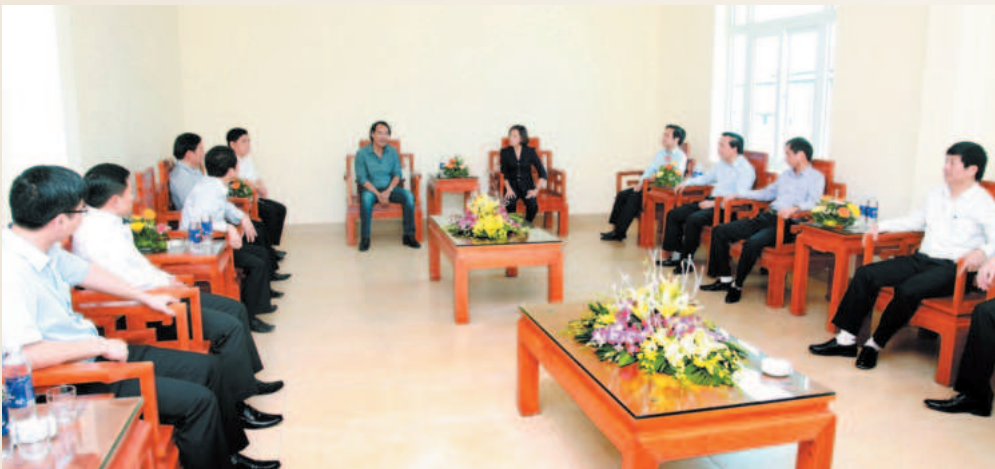
Công ty cổ phần Bình Điền - Ninh Bình đón tiếp đoàn lãnh đạo tỉnh Ninh Bình đến thăm và làm việc tại Công ty

Cùng với nâng cao chất lượng các sản phẩm truyền thống, Công ty Cổ phần Bình Điền - Ninh Bình còn đẩy mạnh áp dụng khoa học công nghệ vào sản xuất, phát triển các sản phẩm mới phù hợp với xu thế. Thông qua đó, góp phần phát triển nền nông nghiệp xanh, bền vững, không chỉ phụng sự người nông dân, nền nông nghiệp địa phương, mà còn hướng đến các tỉnh lân cận và quốc gia trong khu vực.