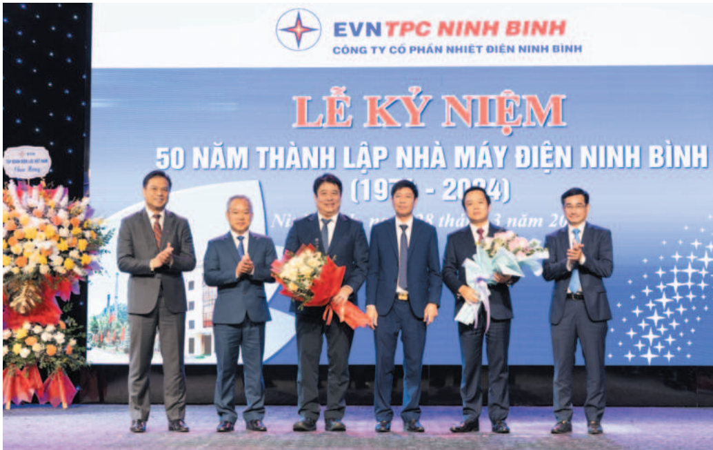
Lễ kỷ niệm 50 năm thành lập Nhà máy Nhiệt điện Ninh Bình (1974 - 2024)

Nằm bên bờ sông Đáy, Công ty Cổ phần Nhiệt điện Ninh Bình (tiền thân là Nhà máy điện Ninh Bình) đã gắn bó với sự phát triển của ngành điện lực Việt Nam suốt 50 năm qua. Với tổng sản lượng khoảng 24 tỷ kWh tính đến năm 2024, Nhà máy không chỉ đóng góp quan trọng vào hệ thống điện quốc gia mà còn ghi dấu ấn sâu đậm trong lòng người dân, là động lực thúc đẩy sự phát triển kinh tế - xã hội của địa phương và cả nước.