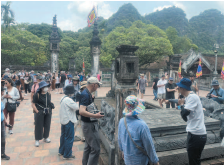
Hoa Lu Ancient Capital is a special national historical and cultural relic complex

K nown as a legendary land, Ninh Binh is not only endowed with majestic and unique natural landscapes, but also historical and cultural relics and distinctive religious architectural works. Particularly, Hoa Lu Ancient Capital is a special national historical and cultural relic complex. Hoa Lu was the first capital of Dai Co Viet, the first centralized feudal state and the place where Dinh, Early Le and Ly dynasties started their monarchies.