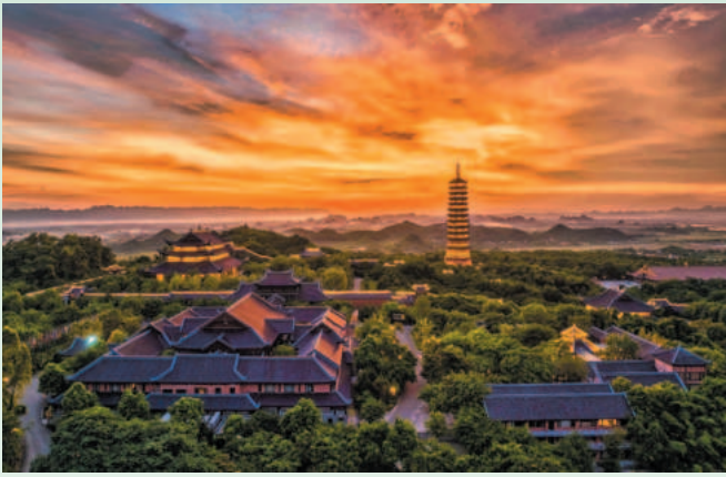
Bai Dinh Pagoda in Ninh Binh province is a major spiritual site, attracting tens of thousands of Buddhist pilgrims annually

Ninh Binh province has conducted market research, boosted domestic and international advertising and cooperation in tourism development, applied information technology and digital transformation, developed tourism human resources with a reasonable structure to ensure enough qualified human resources, especially executive and operative staffs.