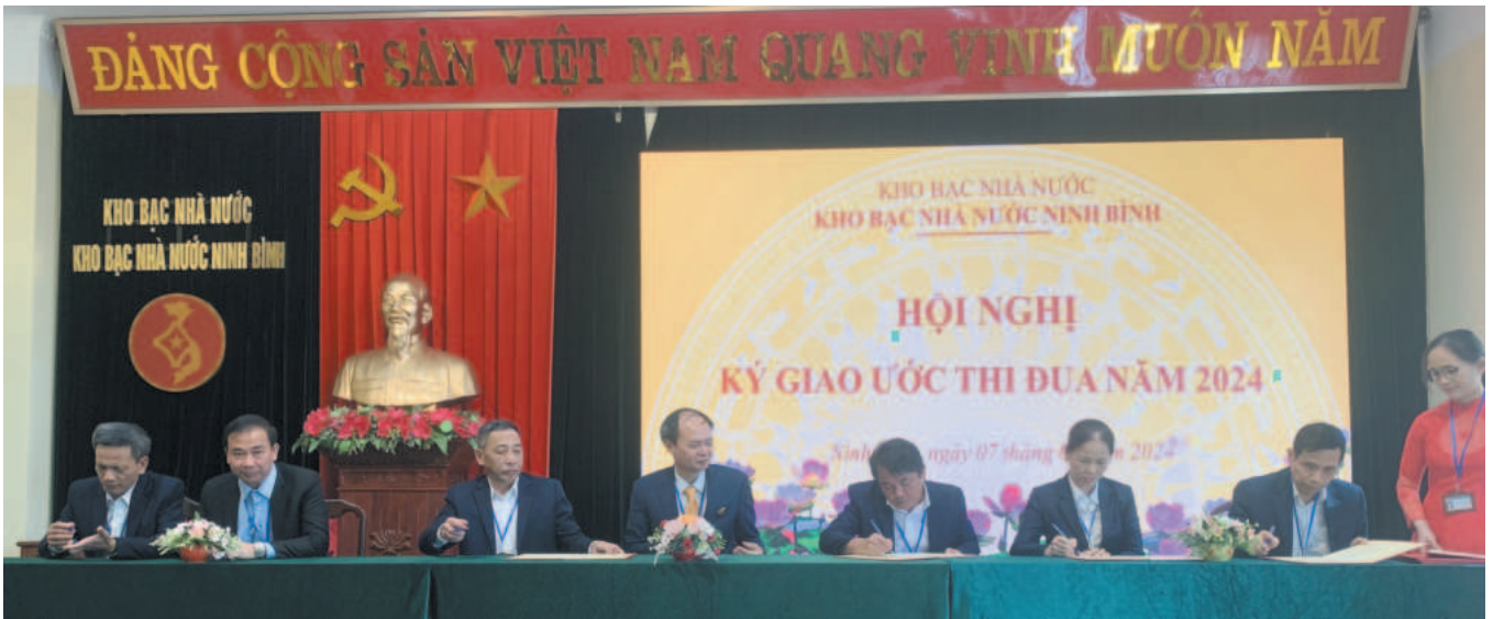
Kho bạc Nhà nước Ninh Bình tổ chức hội nghị ký giao ước thi đua năm 2024