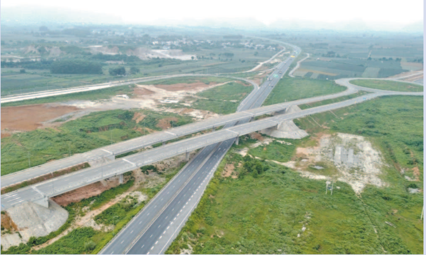
Dự án đường Đông - Tây tỉnh Ninh Bình (giai đoạn 1)

xây dựng cao tốc Ninh Bình - Hải Phòng; đối với hệ thống đường tỉnh: Trên cơ sở mạng lưới quy hoạch, tỉnh đã lựa chọn những tuyến đường giao thông kết nối vùng, liên vùng và các tuyến đường đô thị trọng điểm như: Đường Đông - Tây; tuyến đường ĐT.482, tuyến đường bộ ven biển,... Sau khi những dự án này hoàn thiện sẽ tạo ra mạng lưới giao thông hoàn chỉnh để kết nối các vùng, kết nối miền núi với miền biển, đô thị với nông thôn, địa phương với Trung ương, đồng thời mở ra các không gian, dư địa mới để thu hút các nhà đầu tư khu công nghiệp, khu đô thị.