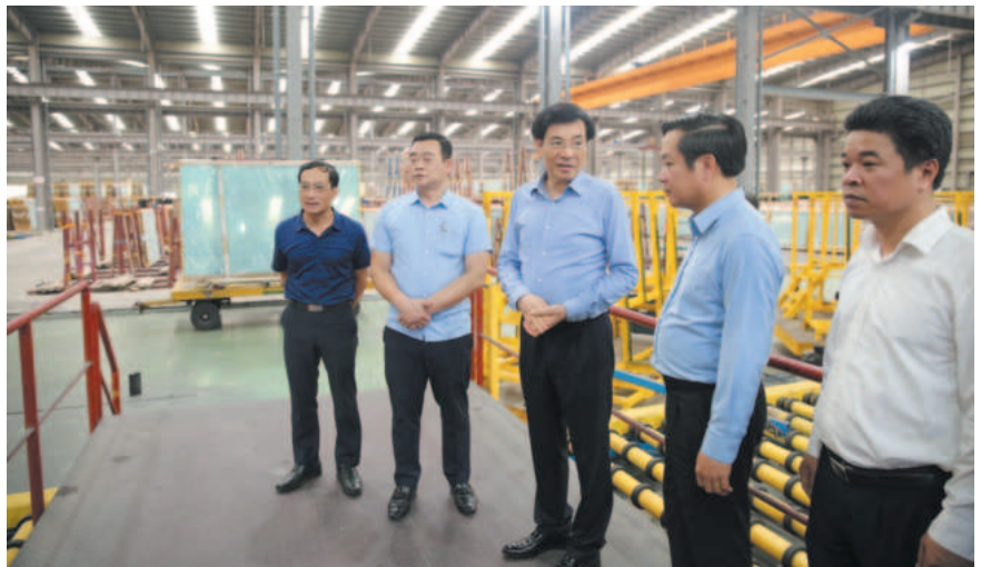
The delegation of government officials, led by Mr. Tran Van Son, Minister and Chairman of the Government Office, conduct san inspection of the production and business activities in Ninh Binh province

Second, working with relevant agencies and consultants to develop the Ninh Binh Provincial Planning for the 2021 - 2030 period, with a vision to 2050, approved by the Prime Minister in Decision 218/QĐ-TTg dated March 4, 2024.