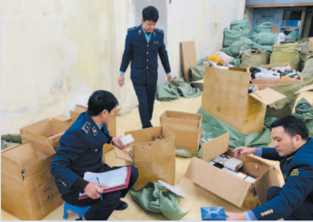
Lực lượng quản lý thị trường tỉnh Ninh Bình kiểm tra cơ sở sản xuất