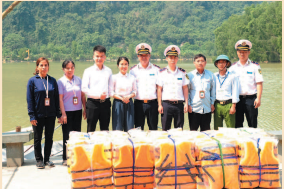
Cảng vụ Đường thủy nội địa tỉnh Ninh Bình tặng áo phao, tuyên truyền đảm bảo an toàn đường thủy tại các bến đò, thuyền du lịch

Đồng thời, nghiêm túc chấp hành đầy đủ những quy định của Nhà nước và pháp luật theo chức năng, nhiệm vụ được giao, trên cơ sở đó đề ra những quy định, quy chế hoạt động cụ thể phù hợp với chuyên môn, nghiệp vụ của mình. Tập trung nghiên cứu hệ thống cảng, bến trên địa bàn quản lý để tham mưu, đề xuất với lãnh đạo ngành về quy hoạch cảng, bến cho phù hợp với sự phát triển lâu dài và ổn định; lập danh bạ và thực hiện các thủ tục pháp lý liên quan đến cảng, bến thủy nội địa; tăng cường công tác tuyên truyền pháp luật hướng dẫn cho các chủ cảng nắm bắt và thực hiện,... Đến nay, các cảng, bến thủy nội địa do đơn vị quản lý đã tự giác chấp hành những quy định về an toàn khai thác cảng, tạo điều kiện thuận lợi cho các phương tiện thủy ra, vào bến, cảng an toàn. ■