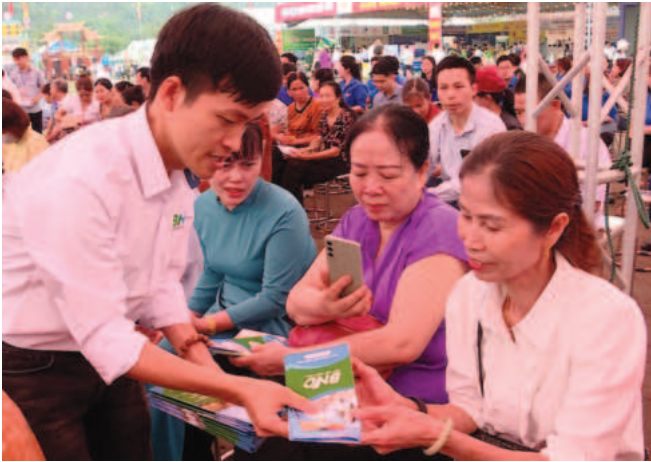
Đại diện doanh nghiệp tuyên truyền, giới thiệu về vị trí việc làm cho người dân Ninh Bình tại phiên giao dịch việc làm lưu động được tổ chức ngày 17/4/2024

Đổi mới, nâng cao chất lượng, hiệu quả đào tạo nghề gắn với giải quyết việc làm cho người lao động và chuyển dịch cơ cấu kinh tế được Ninh Bình xác định là nhiệm vụ trọng tâm, lợi thế cạnh tranh trong thu hút đầu tư và phát triển kinh tế - xã hội trong giai đoạn tiếp theo.