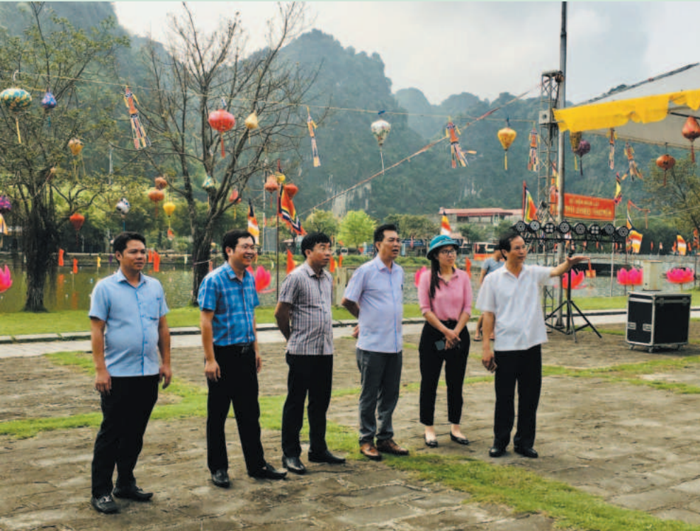
Lãnh đạo Huyện ủy Hoa Lư kiểm tra công tác chuẩn bị cho việc tổ chức Lễ hội Hoa Lư năm 2024

Từ một huyện còn nhiều khó khăn trong phát triển kinh tế, Hoa Lư hôm nay đang ngày càng “thay da đổi thịt”, kinh tế phát triển mạnh mẽ theo hướng toàn diện, bền vững, đặc biệt là công nghiệp, tiểu thủ công nghiệp và du lịch, dịch vụ.