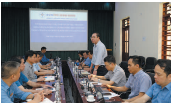
Đoàn công tác của Tập đoàn Điện lực Việt Nam thăm và làm việc tại Công ty Cổ phần Nhiệt điện Ninh Bình, ngày 02/4/2024