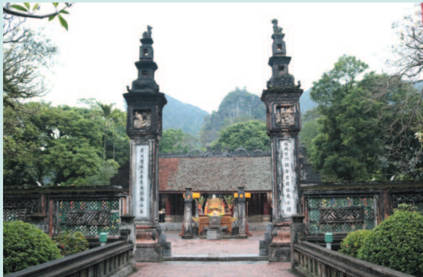
Di tích lịch sử - văn hóa Cố đô Hoa Lư là một quần thể di tích quốc gia đặc biệt

Là vùng đất “địa linh nhân kiệt”, Ninh Bình không những được tạo hóa ban tặng nhiều cảnh quan thiên nhiên hùng vĩ, độc đáo mà còn là nơi lưu giữ nhiều di tích lịch sử - văn hóa, công trình kiến trúc tôn giáo đặc sắc. Trong đó, di tích lịch sử - văn hóa Cố đô Hoa Lư là một quần thể di tích quốc gia đặc biệt. Hoa Lư là kinh đô đầu tiên của nhà nước Đại Cồ Việt, nhà nước phong kiến trung ương tập quyền đầu tiên, nơi phát tích sự nghiệp 3 triều đại: Đinh - Tiền Lê và khởi đầu triều Lý.