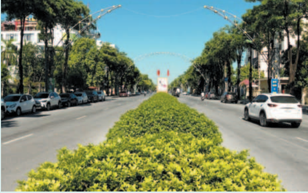
Không gian xanh trên các tuyến đường TP.Ninh Bình