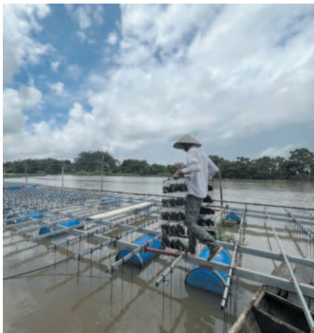
The company invests significantly in its pearl cultivation process

In addition, the company hopes that local agencies and sectors will provide favorable conditions to have the farming area carrying the identity brand of the ancient capital. ■