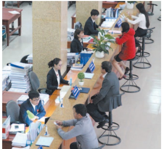
Kho bạc Nhà nước Ninh Bình luôn tạo mọi điều kiện thuận lợi cho khách hàng đến giao dịch

Tin tưởng rằng, với tinh thần nhiệt huyết, năng động, cùng sự đoàn kết, nỗ lực của toàn thể công chức và người lao động, KBNN Ninh Bình sẽ hoàn thành thắng lợi các nhiệm vụ được giao, góp phần thúc đẩy kinh tế - xã hội tỉnh phát triển nhanh và bền vững. ■