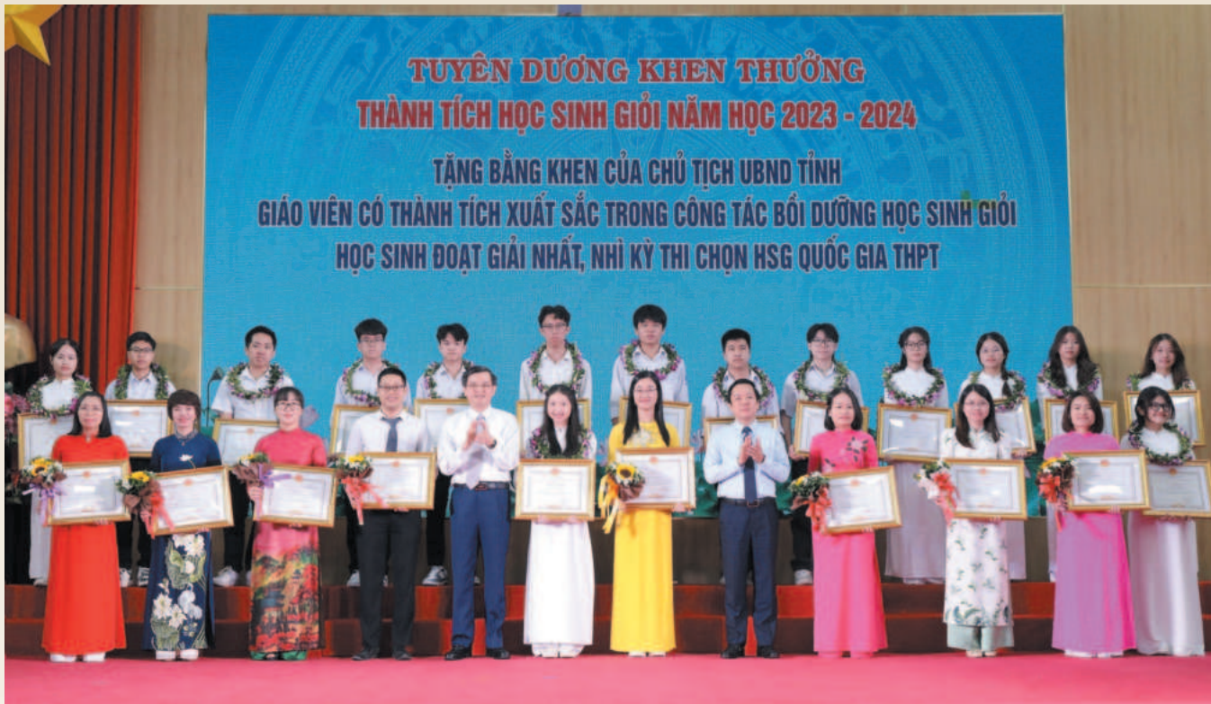
Trường THPT Chuyên Lương Văn Tụy là một trong những trường có giáo viên được nhận Bằng khen của Chủ tịch UBND tỉnh Ninh Bình vì có thành tích xuất sắc trong công tác bồi dưỡng học sinh giỏi, học sinh đạt giải Nhất, Nhì kỳ thi chọn học sinh giỏi quốc gia THPT

Những năm qua, được sự quan tâm của Tỉnh ủy, HĐND, UBND tỉnh, ngành Giáo dục và Đào tạo Ninh Bình đã phát triển toàn diện cả về quy mô, chất lượng và hiệu quả. Trong đó, Trường THPT Chuyên Lương Văn Tụy được xác định là cái nôi đào tạo nguồn nhân lực chất lượng cao, cánh chim đầu đàn trong ngành Giáo dục và Đào tạo vùng đất Cố đô.