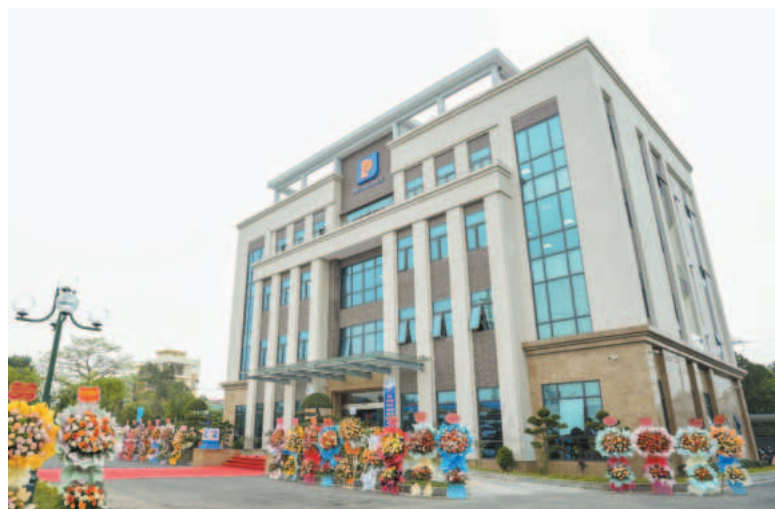
Trụ sở mới của Chi nhánh Xăng dầu Ninh Bình

Thực hiện tốt vai trò là doanh nghiệp nhà nước, những năm qua, Chi nhánh Xăng dầu Ninh Bình đã triển khai nhiều giải pháp đảm bảo nguồn cung ứng xăng dầu, giữ vai trò điều tiết, bình ổn thị trường kinh doanh xăng dầu, góp phần vào sự phát triển và ổn định của địa phương. Chi nhánh luôn chủ