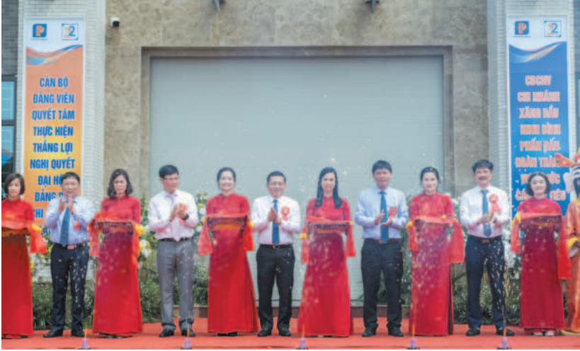
Các đại biểu cắt băng khánh thành Trụ sở Văn phòng Chi nhánh Xăng dầu Ninh Bình

động cân đối nguồn hàng, điều động hàng hóa một cách hợp lý, huy động tối đa nguồn xăng dầu phục vụ hoạt động sản xuất kinh doanh và tiêu dùng trên địa bàn. Đảm bảo chất lượng, số lượng hàng hóa, bán đúng giá, đồng thời kiểm soát chặt chẽ việc niêm yết giá công khai theo đúng quy định.