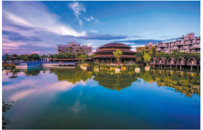
Du lịch là một trong những lợi thế của huyện Nho Quan

Các cụm công nghiệp được xây dựng và hoàn thiện, với hệ thống đường giao thông, điện, nước và viễn thông hiện đại. Qua đó, giúp giảm thiểu chi phí sản xuất và tăng cường khả năng cạnh tranh của các doanh nghiệp.