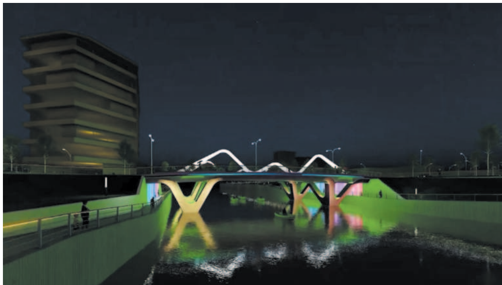
Phối cảnh cầu Cà Là - công trình được xem là điểm nhấn về kiến trúc khu vực nội đô thành phố Ninh Bình trong tương lai

toàn thông tin mạng trên địa bàn. Tập trung tuyên truyền các nhiệm vụ về chuyển đổi số trên hệ thống Đài truyền thanh, trang thông tin điện tử, các Fanpage...; khắc phục tồn tại hạn chế đã chỉ ra trong công tác chuyển đổi số 06 tháng đầu năm. Tổ chức tập huấn công tác chuyển đổi số trên địa bàn; biểu dương, khen thưởng kịp thời đối với phòng, ban, đơn vị, UBND xã, phường làm tốt công tác chuyển đổi số; bố trí kinh phí đảm bảo công tác chuyển đổi số theo quy định.