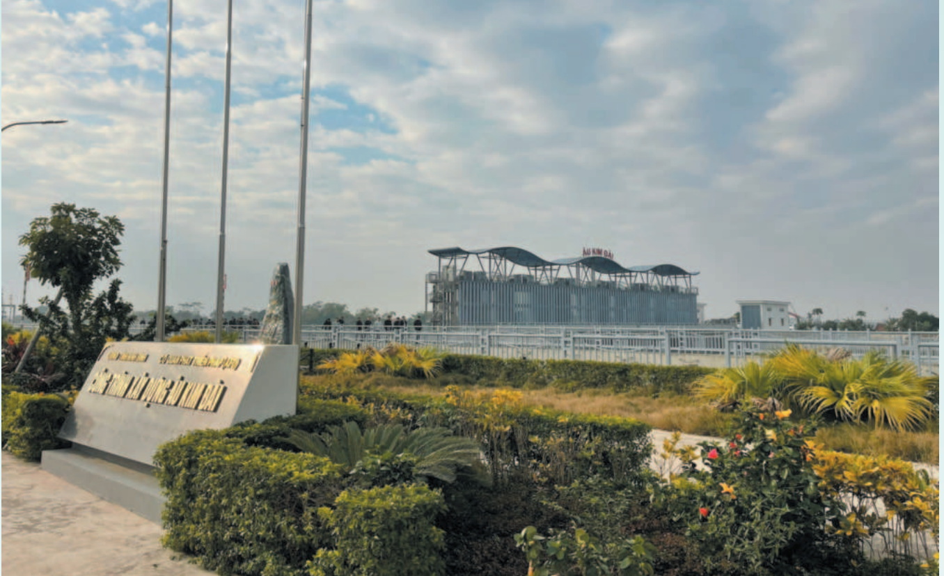
Công trình xây dựng Âu Kim Đài là dự án nhằm ngăn mặn, giữ ngọt và ứng phó với tác động nước biển dâng cho 6 huyện, thành phố khu vực Nam tỉnh Ninh Bình

Đặc biệt, Ban đã đẩy nhanh công tác giải ngân, quyết toán công trình hoàn thành, bàn giao công trình sớm đưa vào khai thác, sử dụng, phát huy tối đa hiệu quả đầu tư. Chỉ trong 6 tháng đầu năm 2024, Ban đã trình phê duyệt 7 công trình quyết toán, bàn giao 3 công trình đưa vào khai thác sử dụng.