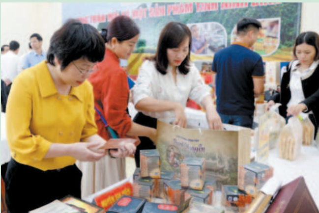
The conference organized by the Department of Agriculture and Rural Development of Ninh Binh province to deploy the One Commune One Product (OCOP) program

D espite having no strengths in large-scale commercial production, Ninh Binh agriculture has a diversity of products grown in five ecological economic subregions: Semi-mountainous subregion, lowland subregion, suburban subregion, plain subregion and coastal subregion. Each subregion will focus on investing and developing key high-tech, organic products.