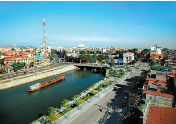
Thành phố Ninh Bình nỗ lực xứng tầm là trung tâm kinh tế của tỉnh