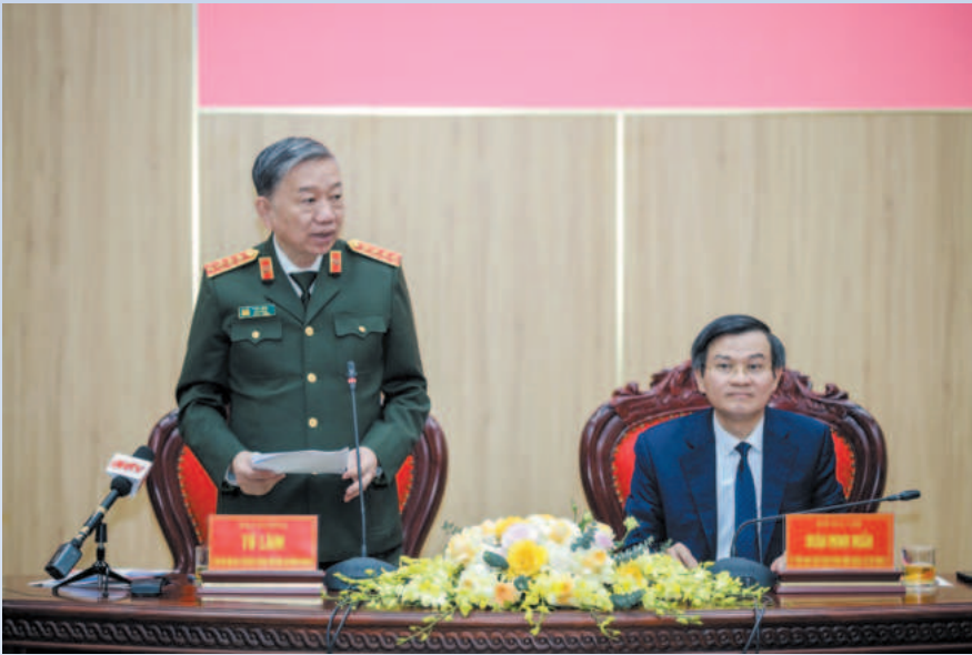
Tháng 2/2024, Đại tướng Tô Lâm - Bộ trưởng Bộ Công an (nay là Tổng Bí thư, Chủ tịch nước) làm việc với Ban Thường vụ Tỉnh ủy Ninh Bình về tình hình, kết quả năm 2023 và phương hướng phối hợp lãnh đạo, thực hiện các nhiệm vụ bảo đảm an ninh, trật tự gắn với phát triển kinh tế - văn hóa - xã hội trên địa bàn tỉnh

Những năm gần đây, Ninh Bình đang tạo dấu ấn tích cực về phát triển kinh tế, thu hút đầu tư và cải thiện môi trường kinh doanh. Góp phần vào thành quả trên, Sở đã tham mưu, thực hiện các giải pháp, hoạt động nào?