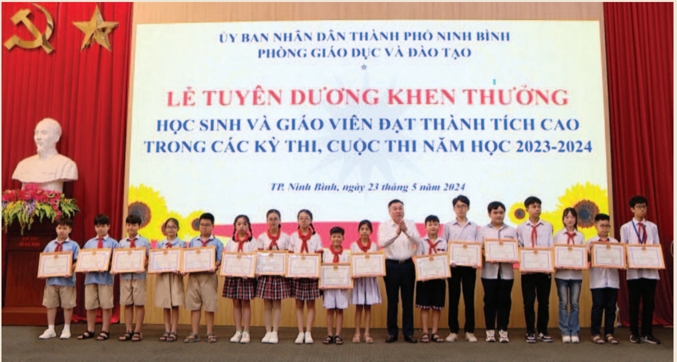
Tỉnh Ninh Bình tổ chức Lễ tuyên dương, khen thưởng học sinh đạt thành tích cao trong các kỳ thi, cuộc thi năm học 2023 - 2024

quốc, là năm học có kết quả cao nhất từ trước đến nay cả về số lượng và tỷ lệ học sinh đạt giải; có 2 học sinh môn Toán, Tin học được tham gia đội dự tuyển Olympic quốc tế. Năm 2024, Ninh Bình là tỉnh có điểm thi tốt nghiệp đứng thứ 2 toàn quốc với điểm trung bình là 7,35; tất cả các môn thi có điểm trung bình trong Top 10 tỉnh, thành phố dẫn đầu toàn quốc, trong đó 7 môn trong Top 5; có 02 thí sinh trong Top 5 thí sinh có điểm thi tốt nghiệp cao nhất toàn quốc, trong đó có 01 thí sinh là thủ khoa điểm thi tốt nghiệp đồng thời là thủ khoa khối C00 toàn quốc.