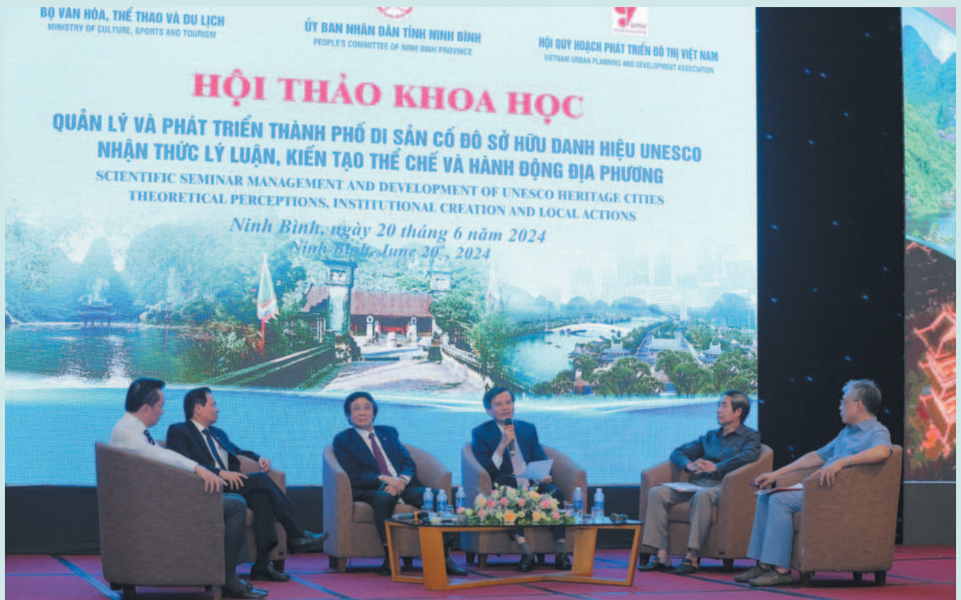
UBND tỉnh Ninh Bình phối hợp tổ chức Hội thảo khoa học về quản lý và phát triển thành phố di sản cố đô sở hữu danh hiệu UNESCO

Không chỉ tích cực tham mưu, hoàn thiện cơ sở pháp lý trong thu hút đầu tư, ngành Xây dựng tỉnh Ninh Bình còn triển khai thực hiện các dự án phát triển đô thị theo hướng văn minh, hiện đại.