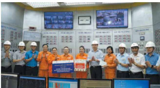
Tập đoàn Điện lực Việt Nam tặng quà cho cán bộ, nhân viên Công ty Cổ phần Nhiệt điện Ninh Bình tham gia phong trào thi đua trong công tác giảm sự cố, đảm bảo sẵn sàng phát điện năm 2024

☞ một bước đi quan trọng của Nhà máy Nhiệt điện Ninh Bình trong việc thích ứng với xu hướng phát triển bền vững của ngành điện lực thế giới.