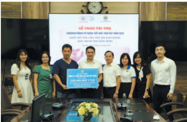
DATC consistently prioritizes volunteer activities and community responsibility, demonstrating commitment through meaningful and practical actions

years on the one hand and expanded debt purchases and conducted corporate restructuring to improve competitiveness on the other hand. In addition, DATC also actively applied regulatory procedures on divestments, including corporate divestments in five latest years from the time DATC became a shareholder but interested investors who sought to increase capital turnover and capital efficiency.