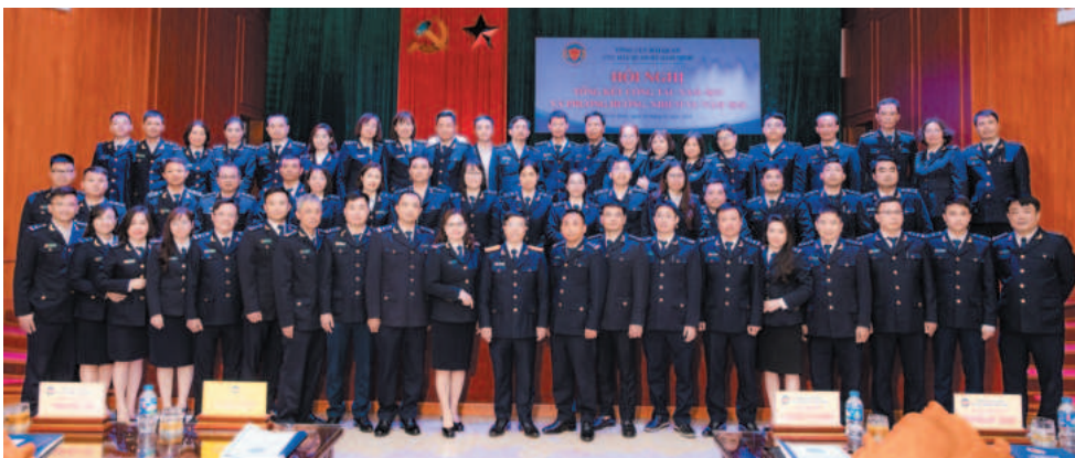
Tập thể cán bộ Cục hải Quan Hà Nam Ninh