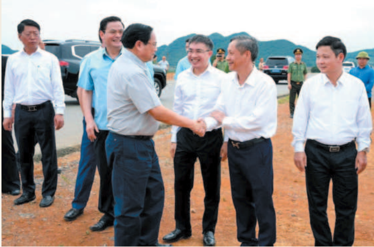
Thủ tướng Phạm Minh Chính kiểm tra tình hình thi công và thăm hỏi, động viên công nhân, người lao động trên công trường tuyến đường Đông - Tây, tỉnh Ninh Bình

Cùng với làm tốt công tác quy hoạch, cải thiện môi trường kinh doanh, thành phố Tam Điệp còn chủ động phối hợp với các sở, ngành đẩy mạnh thu hút đầu tư, phát triển công nghiệp, dịch vụ và du lịch, tạo động lực phát triển toàn diện, bền vững, xứng đáng là một trong 3 vùng kinh tế trọng điểm của tỉnh Ninh Bình.