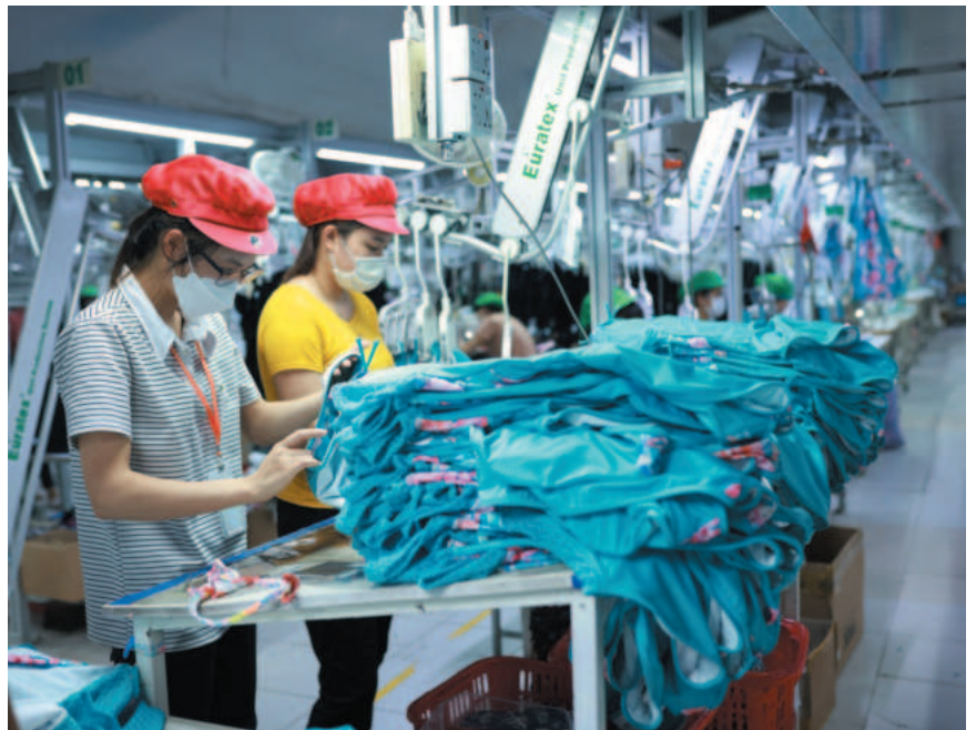
Công ty TNHH Thời trang Itas Mars Intimates đầu tư xây dựng xưởng may thông minh, các chuyên may tự động, đem lại hiệu quả thiết thực

Với phương châm "Chất lượng là trên hết", chị tập trung vào việc nâng cao chất lượng sản phẩm và xây dựng uy tín cho thương hiệu Itas Global. Chị luôn đặt mình vào vị trí của khách hàng để hiểu rõ nhu cầu và mong muốn của họ, từ đó tạo ra những sản phẩm không chỉ đẹp về hình thức mà còn bền bỉ và tiện dụng.