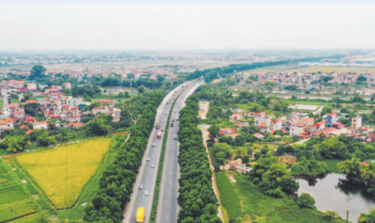
Caos tốc Cầu Giẽ - Ninh Bình đóng vai trò quan trọng trong việc phát triển kinh tế của Ninh Bình nói riêng và khu vực nói chung

Quy hoạch tỉnh Ninh Bình được Thủ tướng Chính phủ phê duyệt thể hiện rõ chiến lược phát triển của tỉnh đã và đang tập trung triển khai thực hiện với “Một chiến lược” dựa trên