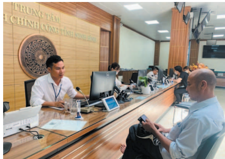
Người dân, doanh nghiệp thuận lợi trong việc giải quyết các thủ tục hành chính tại Trung tâm Phục vụ hành chính công tỉnh Ninh Bình

Hệ thống đã triển khai đến 100% các sở, ban, ngành và UBND các huyện, thành phố (29 cơ quan, đơn vị); thực hiện khai báo, cấp 1.565 tài khoản người dùng và tổ chức tập huấn cho 1.164 cán bộ, công chức, viên chức của các cơ quan, đơn vị. Ngày 17/3/2023, UBND tỉnh đã ban hành Quyết định số 14/2023/QĐ-UBND ban hành Quy chế quản lý, vận hành và khai thác Hệ thống thông tin phục vụ họp và xử lý công việc tỉnh Ninh Bình (eCabinet).