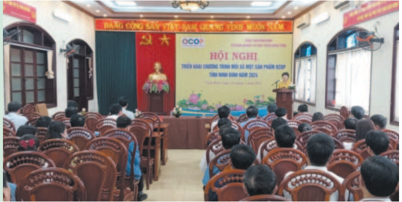
Sở Nông nghiệp và Phát triển nông thôn tỉnh Ninh Bình tổ chức hội nghị triển khai chương trình mỗi xã một sản phẩm OCOP

K hông có thể mạnh về sản xuất hàng hóa lớn nhưng nông nghiệp Ninh Bình lại có sự đa dạng về sản phẩm với 05 tiểu vùng kinh tế sinh thái: Tiểu vùng núi bán sơn địa, tiểu vùng trung, tiểu vùng ven đô thị, tiểu vùng đồng bằng, tiểu vùng ven biển. Mỗi tiểu vùng có sản phẩm chủ lực định hướng tập trung đầu tư, phát triển theo hướng ứng dụng công nghệ cao, hữu cơ.