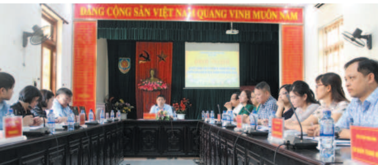
Sở Tư pháp tỉnh Ninh Bình tổ chức hội nghị sơ kết 6 tháng đầu năm và triển khai công tác 6 tháng cuối năm 2024