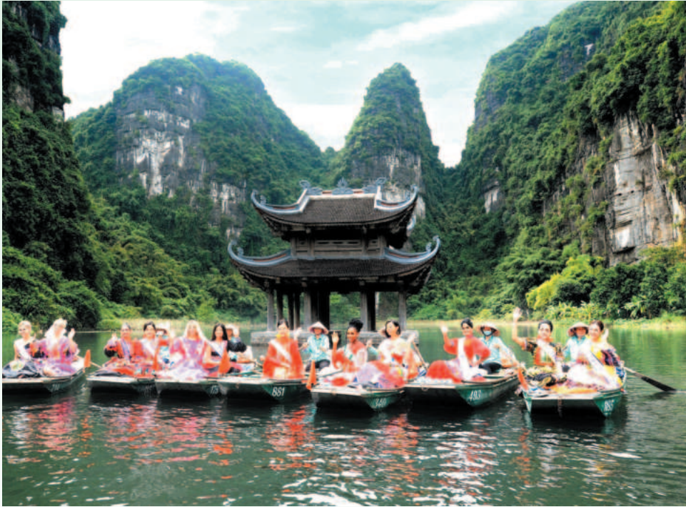
Trang An Scenic Landscape Complex was inscribed as a UNESCO World Heritage Site in 2014

With a consistent green, sustainable tourism and community-based tourism development strategy that upholds natural, cultural and historical values and with a meticulous approach, Ninh Binh province has increasingly asserted its position as a must-visit destination for domestic and foreign tourists. The province strives to become a major tourist center by 2045, among the Top 10 tourist destinations in Southeast Asia and make tourism a key economic sector that contributes 10% of the gross regional domestic product (GRDP).