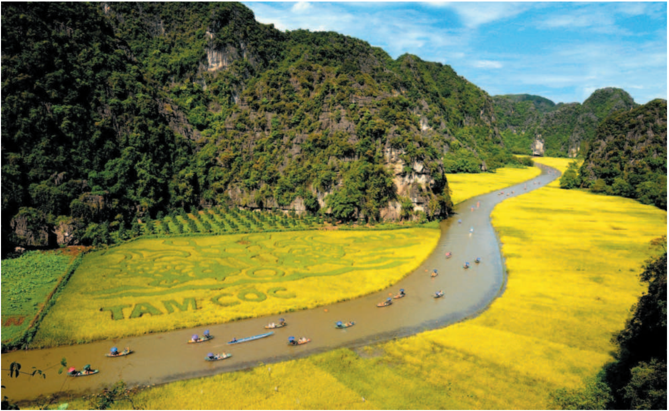
Tam Coc-Bich Dong is part of the Trang An Scenic Landscape Complex recognized by UNESCO as a World Cultural and Natural Heritage

businesses. In addition, the department organized conferences with tenants in industrial zones and FDI firms to encourage, share, listen to their difficulties and obstacles, receive their recommendations and proposals, especially during the complicated developments of the COVID-19 pandemic and volatile world political and economic developments. It also reformed investment promotion and attraction activities in a multidimensional, multimodal, substantive and effective manner together with speeding up administrative reform and digital transformation.