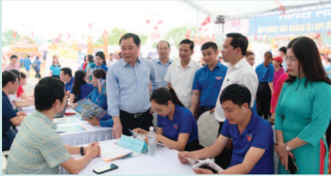
Trung tâm dịch vụ việc làm tỉnh phối hợp với Tỉnh đoàn Ninh Bình tổ chức phiên giao dịch việc làm lưu động tháng 4/2024

Thông qua nhiều giải pháp, đặc biệt là đa dạng hóa hình thức tuyên truyền, đẩy mạnh thông tin thị trường lao động, Trung tâm Dịch vụ việc làm (DVVL) tỉnh Ninh Bình đã tạo cầu nối cung - cầu hiệu quả để người dân, doanh nghiệp tiếp cận thông tin việc làm nhanh nhất, thụ hưởng chính sách và thực hiện đúng quy định của pháp luật.