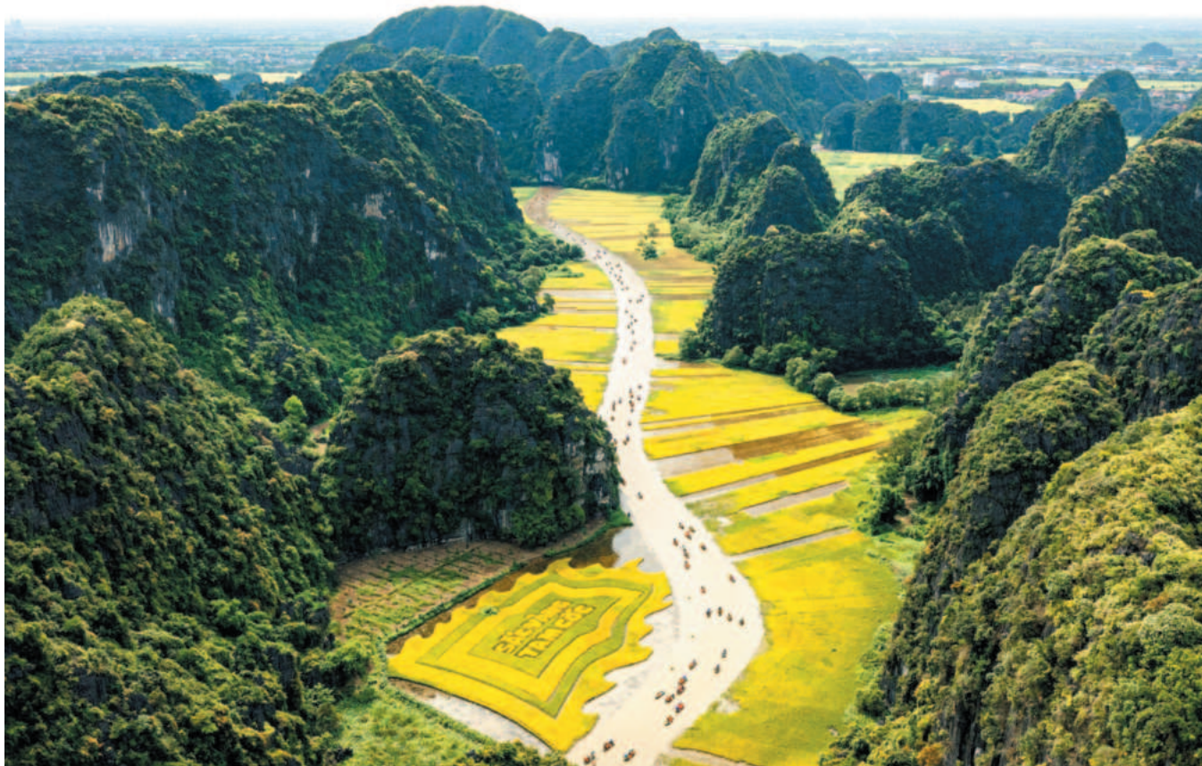
Tam Cốc Bích Động sở hữu cảnh sắc làng quê yên bình cùng hệ thống hang động núi đá vôi ấn tượng

Với chiến lược xuyên suốt là phát triển du lịch xanh, bền vững; du lịch dựa vào cộng đồng, tôn trọng giá trị tự nhiên, lịch sử văn hóa một cách tối đa cùng với cách làm bài bản, Ninh Bình đang ngày càng khẳng định vị thế, trở thành điểm đến không thể bỏ qua của du khách trong và ngoài nước.